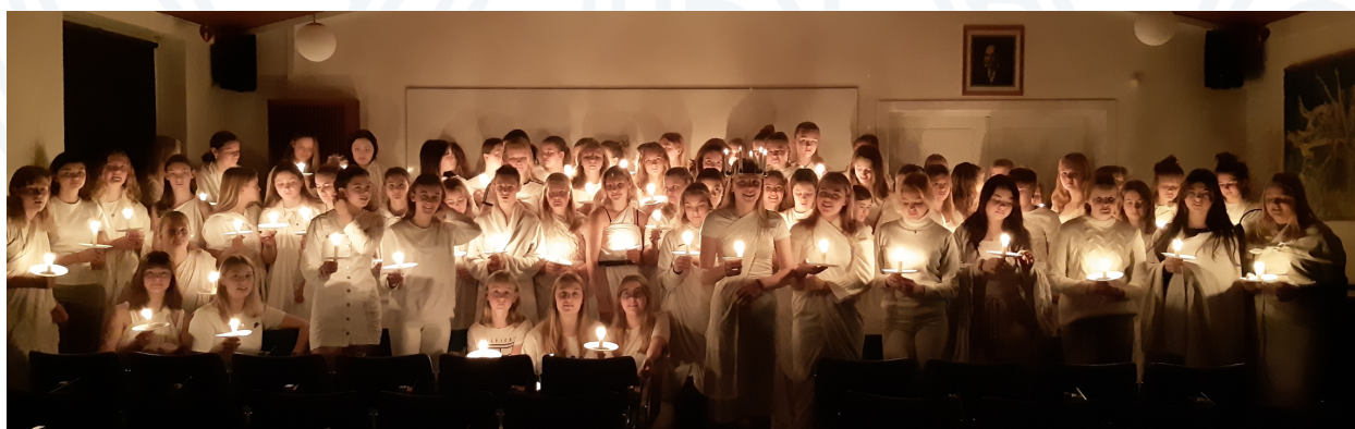
Pigerne vækkede drengene den 13. december med Luciaoptog gennem alle deres værelser.